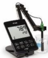
HI 2040-01 DO電極が付属 (電極を替えれば pHとEC測定も可能) 167,000円