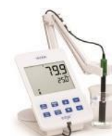
HI 2004-01 DO電極が付属 DO専用器 155,000円