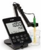
HI 2030-01 EC電極が付属 (電極を替えれば pHとDO測定も可能) 167,000円