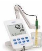
HI 2003-01 EC電極が付属 EC専用器 155,000円