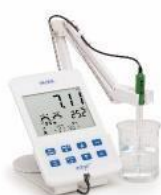
HI 2002-01 pH電極が付属 pH専用器(電極を替え ればORP測定も可能) 98,000円