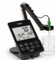
HI 2020-01 pH電極が付属 (電極を替えれば ECとDO測定も可能) 115,000円

ブラックの本体は電極を替えることでpH、EC、DOの測定が可能。ホワイトの本体はpH、EC、DOの専用器。ブラック/ホワイトともに測定項目の仕様や基本性能は同じですので、測定項目に合わせてお選びください。